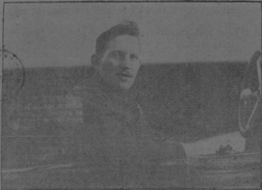
PREVOST EL AVIADOR DE FAMA MUNDIAL A QUIEN LA COMISION DE FESTEJOS HA HECHO PROPOSICION PARA QUE VINGA A VOLAR DURANTE LAS FIESTAS

Interés grande ha despertado en todos los círculos sociales y especialmente deportivos de esta capital las noticias que hemos estado publicando en este diario acerca de las probabilidades—que ya es cosa segura—de que tengamos asistido durante las Fiestas Civicas. El Presidente de la Comisión de Fiestas hizo ayer esta declaración a los reporteros: — Pueden dar ustedes la noticia, de manera oficial, que de cualquier modo tendremos aviación en las Fiestas, y agregar, que en el aeroplano que trae Roland Passiflor, yo sé de uno de los que lo acompañan en cualquier vuelo.